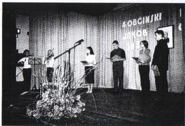
Mladi iz Trnovske vasi so predstavili pesmi svojih rojakov.