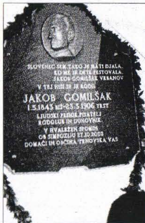
Spominska plošča Jakobu Gomilšaku.